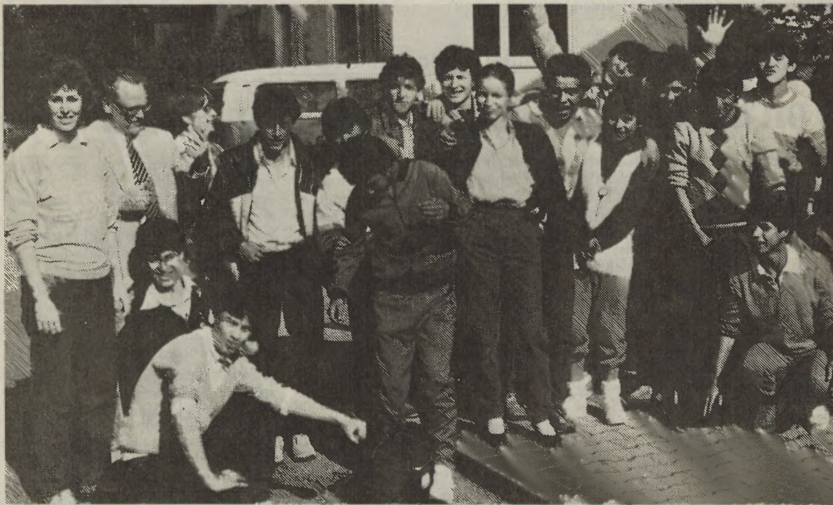
Sichtlich wohl fühlen sich die 40 ehemaligen Straßenkinder aus Bogotá nach ihrer Ankunft in Stuttgart

Zu Gast in Stuttgart: Ehemalige Straßenkinder aus der Hauptstadt Kolumbiens