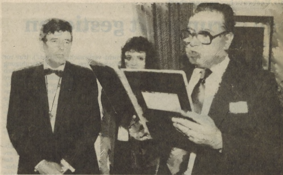
Der neue kolumbianische Konsul (links) bei der Vereidigung