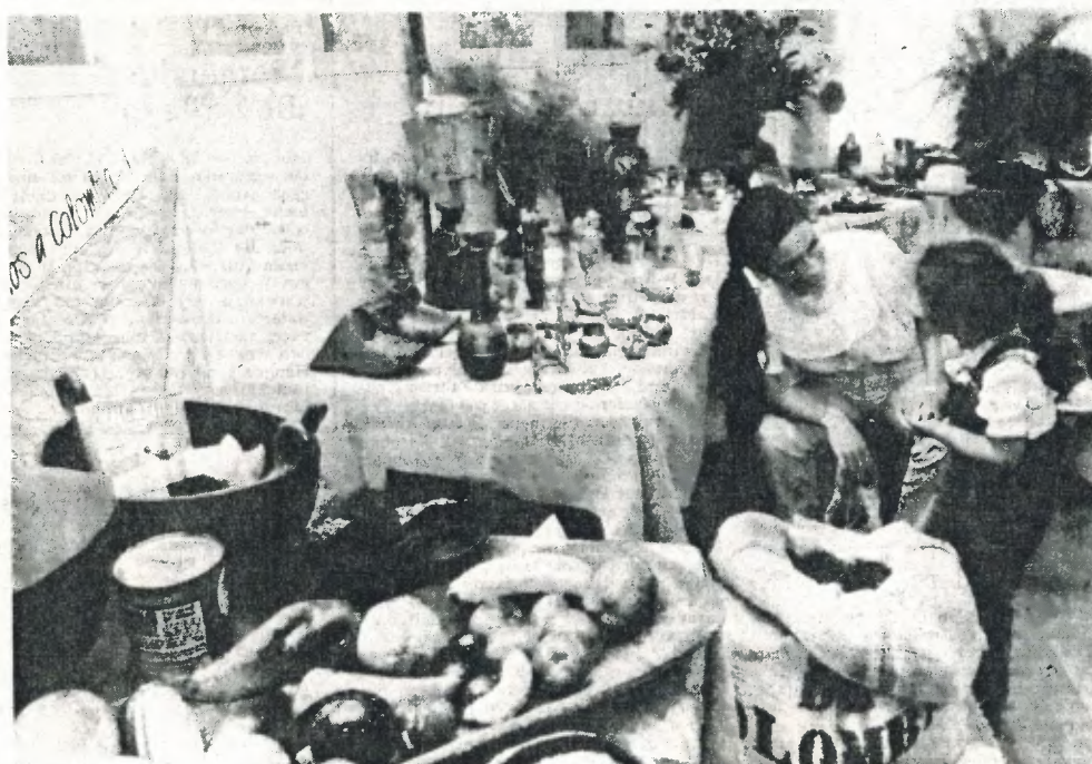
Auch die Kaffeebohnen der Kolumbienausstellung sind echt. Und die darf man sogar anfassen.