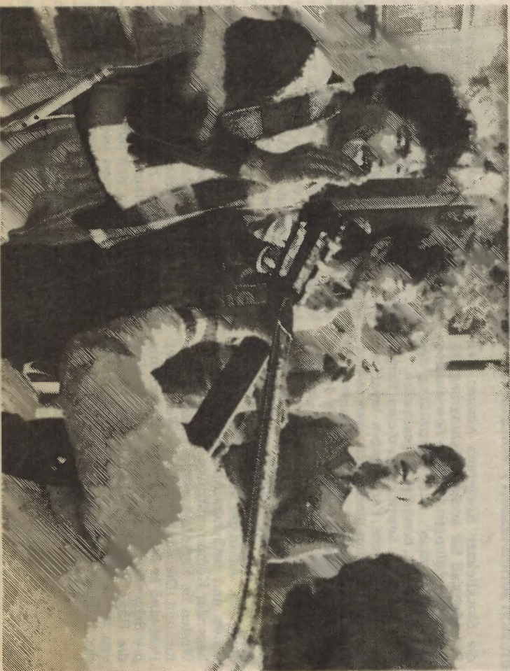
D... Elend der Straße entronnen, haben sie sich der Musik verschrieben.

Mehr als 10 000 verlassene Kinder leben nach Schätzungen privater Hilfsorganisationen zur Zeit in Bogotá. 30 000 sind es im ganzen Land. Und obwohl der neue kolumbianische Präsident, Virgilio Barco der „absoluten Armut“ den Kampf angesagt hat, dürften es in Zukunft kaum weniger werden. Seit Jahrzehnten schon haben es die rund 20 einflußreichen Familien des Landes verstanden, ihre Privilegien zu wahren und eine grundlegende Steuerreform zu verhindern. So werden Kaffee, Öl, Kohle und Touristendevisen dem Andenstaat dieses Jahr zwar ein Wirtschaftswachstum zwischen fünf und sechs Prozent beschereeren. An den Armsten der Armen wird die