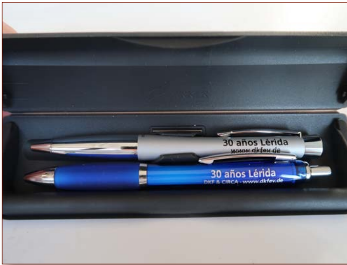
Kugelschreiber für Lehrerkollegium