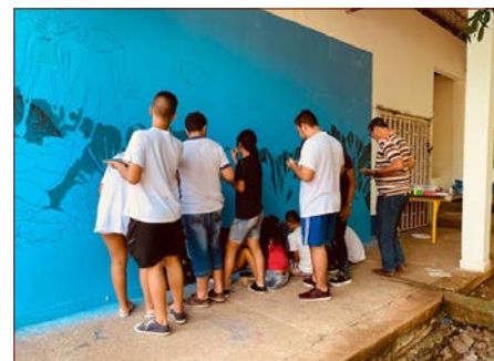
Schüler bei der Erstellung des Wandbildes