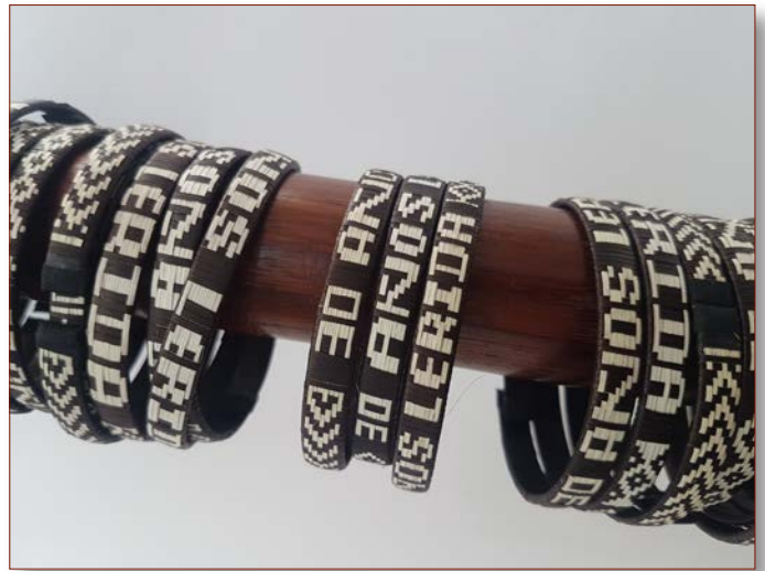
Freundschaftsbändchen aus caña flecha