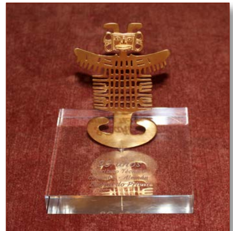
pectoral de la cultura precolombiana tolimese