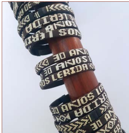
Brazaletes de caña flecha