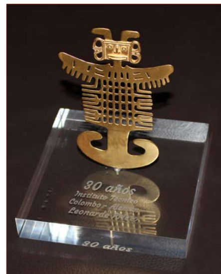
Vom Goldschmied und Künstler Omar Hurtado geschaffene Skulptur

Während des Festaktes konnte ich im Rahmen meines Grußwortes als Präsident der Beca Konder-Stiftung zur Über-