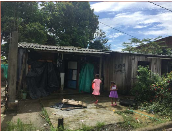
Kinder in Pizarro