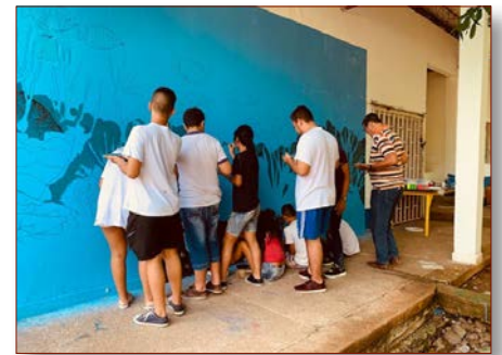
Schüler bei der Erstellung des Wandbildes