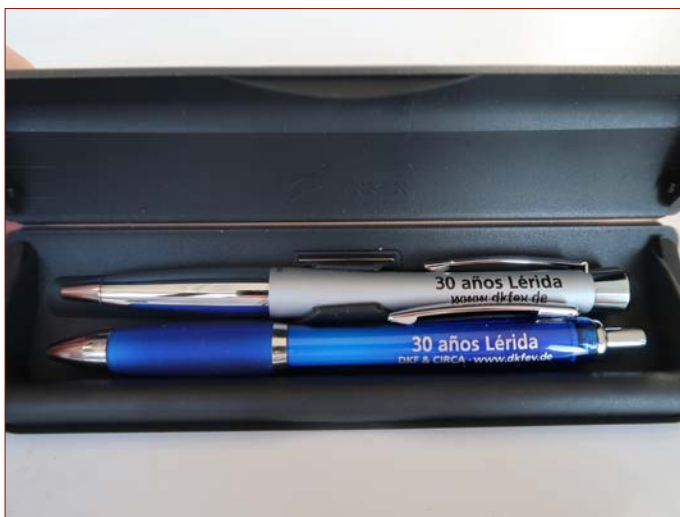
Kugelschreiber für Lehrerkollegium