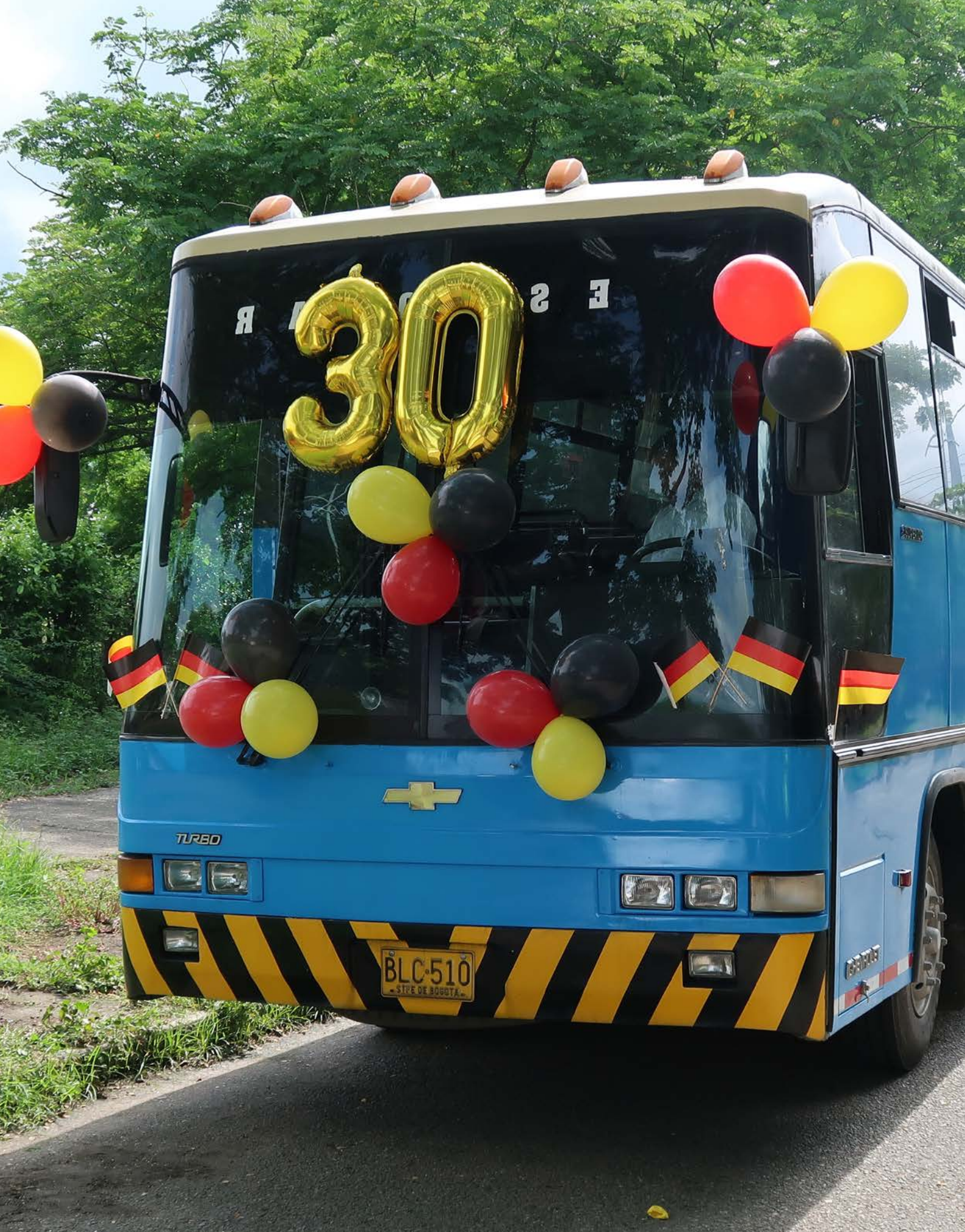
Geschenk des Colegio Andino in Bogotá an „unsere“ Schule in Lérida Regalo del Colegio Andino en Bogotá a “nuestra” escuela en Lérida