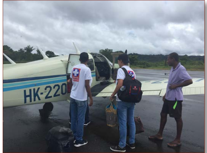
Die beiden Mediziner, die von der Patrulla Aérea Civil del Pacífico abgeholt wurden