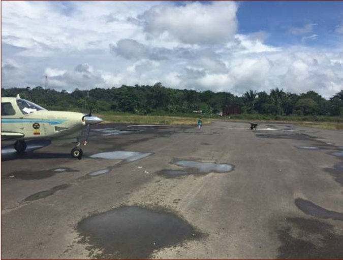
Landepiste in Pizarro