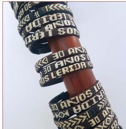
Brazaletes de caña flecha