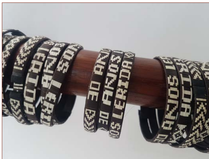
Freundschaftsbändchen aus caña flecha