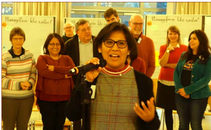
Diskussion mit viel Latina-Frauen-Power