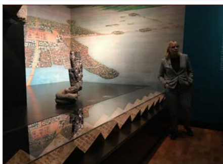
Impressionen von der Aztekenausstellung unter Führung von Frau Dr. Kurella.