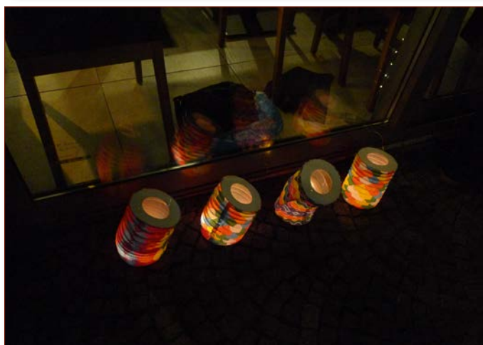
Impresiones del „Día de las velitas“.